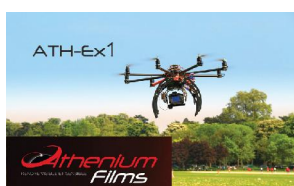
Drône de prise de vue, avec notre partenaire Athenium Films